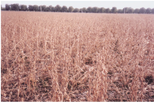
图 3 2004 年中黄 13 在山西襄垣创亩产 312.4 公斤的产量 Fig. 3 In 2004, Zhonghuang 13 produced 312.4 kilograms of per mu in Xiangyuan, Shanxi province