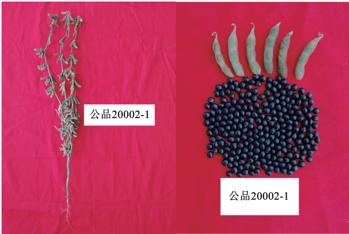
图 2 父本公品 20002-1 成熟收获后植株与籽粒图片

抗倒伏能力强;籽粒圆形,种皮黑色有光泽,种脐黑色,百粒重约为 13.2 g(图 2)。籽粒粗蛋白质含量 41.42%,粗脂肪含量 17.80%。田间表现高抗大豆花叶病毒 1 号株系,高抗大豆花叶病毒 3 号株系。公品 20002-1 具有抗逆性和广适性以及较强的耐盐碱性。