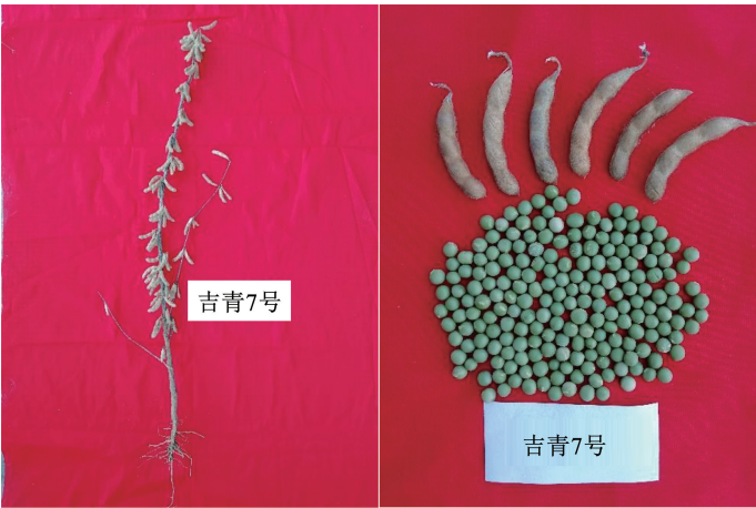
图4 吉青7号的植株及籽粒特征 Fig.4 Harvested plant and seed characters of Jiqing 7

3 d。该品种平均株高83.6 cm,花呈白色,茸毛呈灰色,叶子呈尖卵形,结荚习性为亚有限、主茎型,主茎上节数为14.4个,每个荚中有3~4粒种子,荚熟时呈灰褐色。吉育7号的单株、豆荚、籽粒及田间表现如图4和图5所示。