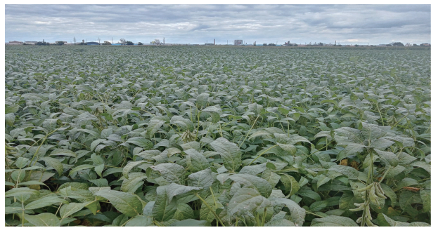
图5 吉青7号田间表现